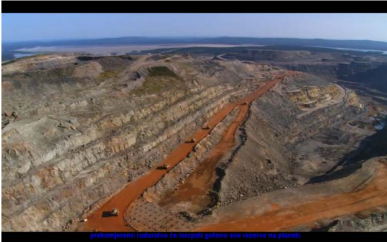
prekomjerno rudarstvo će iscrpiti gotovo sve rezerve na planetu.

onim što je još lijepo, netaknuto, očuvano, božansko, edensko na ovoj našoj 'lopti' povremeno prikazujući i ružnu stranu svega radi stvaranja kontrasta. Slijedeći logiku opisanu u knjizi, Bertrand (redatelj) nas nezadrživo vodi ka temeljnom pitanju koje bi se nakon predivnih scena iz filma moglo jedino ovako formulirati: 'Koji luđak ima srca sve ovo besramno i nemilosrdno uništiti radi trenutačnog profita'? (pitanje koje bi se moglo postaviti vezano uz mnogo toga iz naše realnosti) Bertrand na filmu pokušava provesti u djelo ono što mi sami redovito ne uspijevamo sa vlastitim životom. Naime, svi smo mi uvijek bolno svjesni onoga