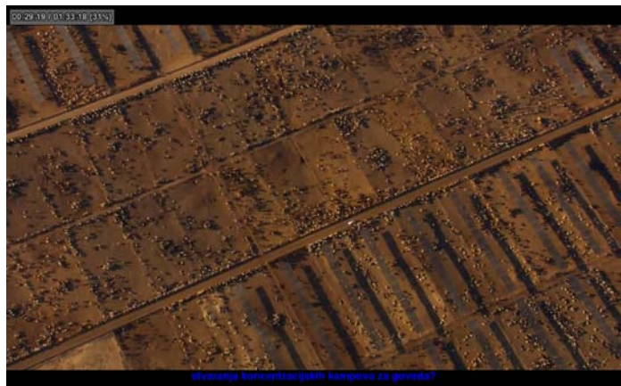
Stvaranje koncentracijskih kampova za goveda?

Svaki nekoliko minuta gledatelju biva prezentirana neka informacija koja izaziva 'WOW' efekt. Podatak koji vjerojatno niste znali ili koji niste imali prilike sagledati u toj perspektivi. Samo za ilustraciju navest ću dio vezan uz proizvodnju mesa u SAD-u. Naime, u filmu se navodi činjenica da gotovo 90% goveda u Americi (namijenjenih proizvodnji mesa) NIKADA u svom cjelokupnom